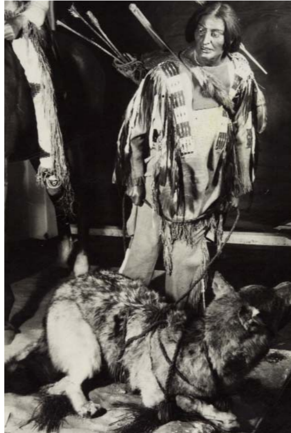
Karl-May-Ausstellung 1949: Indianischer Jäger mit gefangenem Wolf Fotosammlung des Museums für Völkerkunde

So unbekannt aber waren weder das Wort noch die Tat. Schon im 17. Jahrhundert hatte der Verfasser einer Geschichte der Antillen die Bezeichnung gebraucht und mit einer Sitte in Verbindung gebracht, „die, obwohl lächerlich, sich nichtsdestoweniger unter den Bauern einer gewissen Provinz Frankreichs findet.“ Damit war der Ton des beleidigten Erstaunens angeschlagen, mit dem „das Rätsel auf dem Gebiet der Völker-