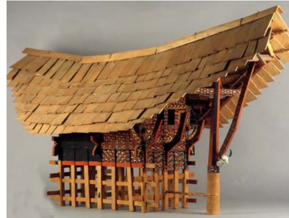
Hausmodell der Toraja, Sulawesi Museum für Völkerkunde Wien

Ein avantgardistischer „Reisefilm“ im Museum für Völkerkunde. Das Museum erklärt fremde Kulturen mit ihren Mannigfaltigkeiten an kulturellen Äußerungen, John Tylo hingegen zeigt sie – ohne Ansatz eines Erklärungsversuches, ohne Kommentar, nur mit Originalton. Der Film erscheint beinahe ungeschnitten, die Kamera fängt über lange Strecken (im zeitlichen als auch räumlichen Sinn) das ein, was ein Reisender sieht, der im Bus entlang des Nils durch Afrika fährt. Diskussion mit John Tylo