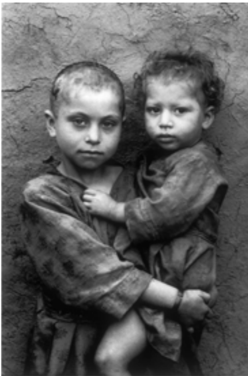
„Das Lager Kamaz in Mazare Sharif für afghanische Flüchtlinge, Afghanistan“.

WestLicht. Schauplatz für Fotografie – assoziierte Leica Galerie Wien – präsentiert von 29. November 2005 bis 05. Februar 2006 die erste große Einzelausstellung des brasilianischen Starfotografen Sebastião Salgado in Österreich. „The Children of Exodus“ zeigt Porträts von Kindern aus den Flüchtlingslagern, Waisenhäusern und Landlosensiedlungen Lateinamerikas, Afrikas, Asiens und Europas. Die Werkreihe ist ein Thema aus Salgados groß angelegtem Zyklus Exodus/Migrations, der zwischen 1993 und 1999 auf Reisen in 39 Länder der Erde entstanden ist. Die eindrucksvollen Schwarz-Weiß-Bilder erzählen von Trauer und Leid; zugleich jedoch spiegeln sie in fas-