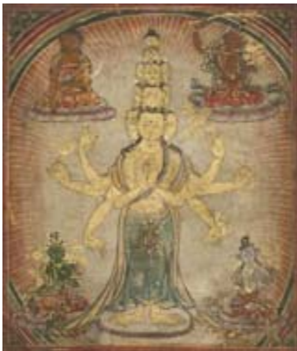
Avalokita oder Ekadasamukha-Avalokitesvara Museum für Völkerkunde Wien, Inv.Nr. 75.098