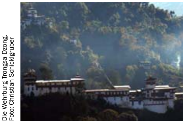
Die Wehrburg Trongsa Dzong.

Es geht um die Mönchsburg Trongsa Dzong, 200 Kilometer östlich der Hauptstadt Thimphu, genauer gesagt um den oberhalb davon gelegenen Wachturm Taa Dzong.