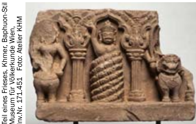
Teil eines Frieses, Khmer, Baphuon-Stil Museum für Völkerkunde Wien, Inv.Nr. 17.1.451.

In Tibet, dem buddhistischen Schneeland, fließt Kunst in das Leben der Menschen mit ein, und praktisch alle Künste werden als heilig empfunden. Die meditative Versenkung in Ikonen, Skulpturen und Mandalas ermöglicht es den Tibetern in Regionen vorzudringen, zu denen man normalerweise keinen Zugang hat. Umgekehrt lassen diese Kunstformen das Mitgefühl der Gottheiten in diese Welt des Leidens und Jammerns hineinscheinen. Die Ritualkarten – tsakali – der Sammlung Hans Leder sind ein Teil dieser Kunst. In Ritualen benutzt, zeigen sie dem westlichen Betrachter den großen ikonographischen Reichtum an Göttern, Dämonen und Beschützern.