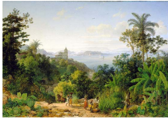
Thomas Ender, Ansicht von Rio de Janeiro, 1837.

im Verschwinden begriffen war, kommen mit starkem Kontrast in zahlreichen Werken zum Ausdruck.