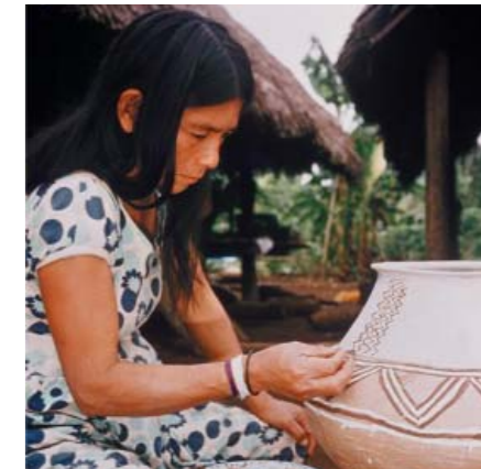
Bemalen eines Topfes, Jivaro

Gegenstände der Wiener Sammlung ermöglichen Einblicke in den Lebenszyklus von Frauen und Männern und in die Geschlechterbeziehung bei den Jivaro.