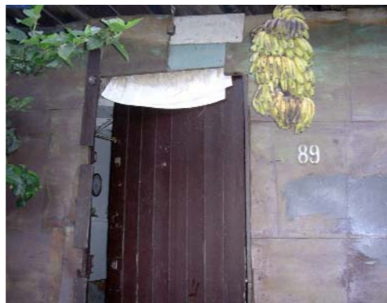
Puerta de Cuca, Regla.

Donnerstag, 15. November 2007, 17.00 Uhr