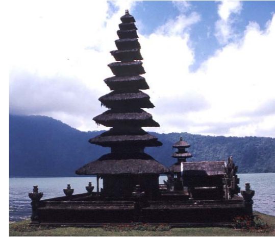
Der Tempel Pura Ulun Danu am Bratan-See, Bali. Foto Claudia Augustat, 1993

als Ausgangspunkt für Exkursionen zu den weltberühmten Tempelanlagen Borobudur und Prambanan. Weiter geht es nach Ostjava, wo der Vulkankrater des Bromos die Hauptattraktion ist. Mit der Fähre geht es auf die hinduistisch geprägt Insel Bali. Neben dem Besuch zahlreicher Tempel und Tanzvorführungen bieten die traumhaften Strände eine willkommene Erholung auf der Reise bevor es weiter nach Sulawesi in das Land der Toraja geht. Abseits vom Massentourismus gibt es hier die Möglichkeit Einblick in die Lebenswelt und den Totenkult dieser indigenen Gruppe zu gewinnen, die unter anderem für ihre traditionelle Architektur bekannt ist. Auf der gesamten Reise stehen neben den Sehenswürdigkeiten immer wieder Einblicke in die Wirtschaftsweise und das Kunsthandwerk der lokalen Bevölkerung im Zentrum.