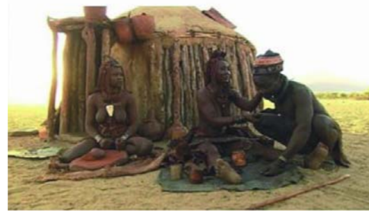
Nikolaus Geyrhalter, „Elsewhere“ (Österreich 2001). Bei der ETHNOCINECA am 24. Mai 2008 um 20:10 Uhr

Die Ethnocineca will all diese Menschen gleichermaßen ansprechen und durch das Aufzeigen von Gemeinsamkeiten und Unterschieden zwischen Menschen unterschiedlicher Herkunft und Kultur, sowie dem Ermöglichen eines interkulturellen Dialogs und eines „Zusammenkommens“ verschiedener Bevölkerungsgruppen durch eine gemeinsame Teilnahme an der Veranstaltung, Diskussionen, Musikveranstaltungen, etc. das Zusammenleben sowie eine gegenseitige Akzeptanz durch ein verstärktes Bewusstsein und Verstehen von Diversität und Gemeinsamkeit fördern. Durch freien Eintritt bzw. eine freiwillige Spende soll allen Bevölkerungsgruppen, egal aus welcher Einkommensschicht, die Teilnahme ermöglicht werden und damit unser Ziel verwirklicht werden.