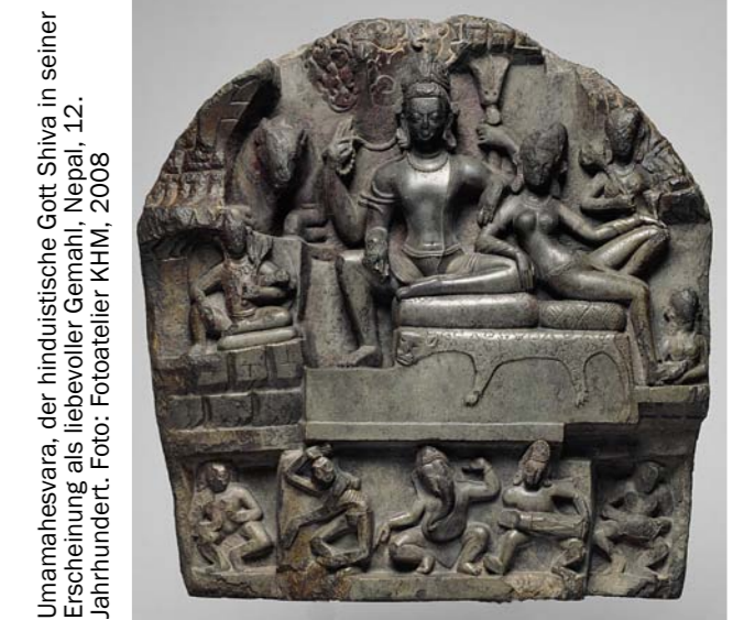
Umamahesvara, der hinduistische Gott Shiva in seiner Erscheinung als liebevoller Gemahl, Nepal, 12. Jahrhundert.