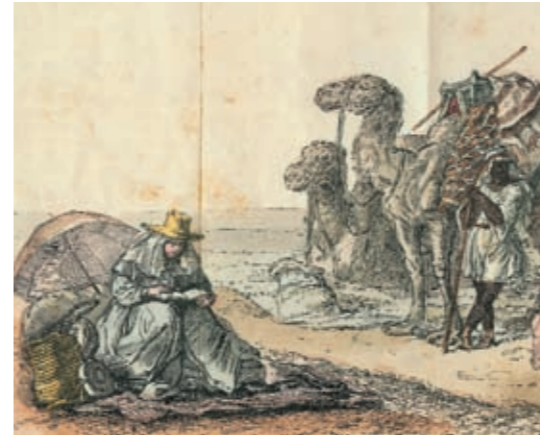
Ida Pfeiffer notiert auf ihrer Orientreise ihre Erfahrungen und Erlebnisse, 1842

son“-Bronzegongs („Kesseltrommeln“) der Welt, wobei neben den umfangreichen Sammlungen in den Museen mehr als 1600 Gongs noch von vielen ethnischen Gruppen (Zhuang, Yao, Sui, Miao, Yi u.a.) in den Hochtälern und Bergen bis heute in Ritualen verwendet werden. Sie erfüllen verschiedene soziale und religiöse Funktionen. In erster Linie sind es landwirtschaftliche Rituale zur Förderung von Regenfall und Fruchtbarkeit, in welchen die Bronzegongs eine zentrale Rolle spielen.