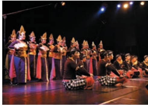
Batavia Madrigal Singers

Preise gewonnen. Im Zuge ihrer Europareise werden sie an einem internationalen Gesangswettbewerb in Maribor teilnehmen und neben ihrem Konzert in Wien auch in Budapest singen.