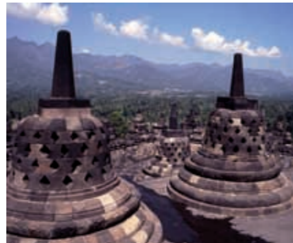
Borobudur, Zentraljava, Foto: Claudia Augustat, 1993

der hinduistische Tempel Prambanan, auf indische Bauformen und Bildgeschichten zurückgehen, ist evident.