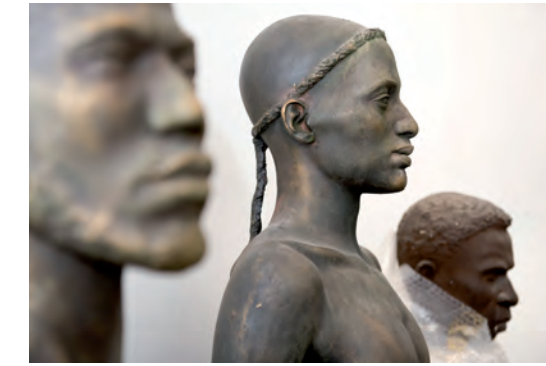
Beispiele aus der Abguss-Sammlung

Vorträge, Führungen und Filmpräsentation Freier Eintritt für Vereinsmitglieder Kostenbeitrag für Nichtmitglieder 4 €