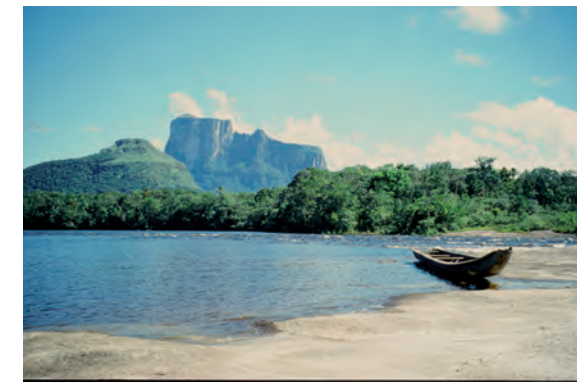
Der Autana-Tepui: Weltenbaum der Piara in Venezuela Foto: Claudia Augustat 1999