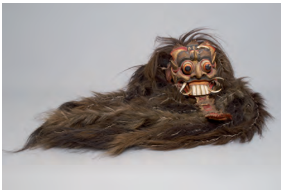
Rangda gilt auf Bali als Verkörperung des Bösen. Ihre Heimat ist der Wald. Indonesien, Bali, vor 1975, MVK Inv.-Nr. 189.024

und Islam, sowie bei den Mayas, Batak und Dayak, dass Wald und Baum als Quelle des Lebens gesehen werden.