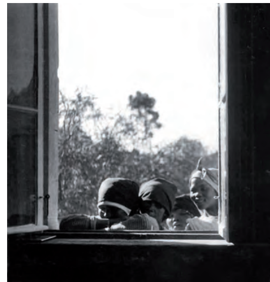
Lichteneckers Photoalbum