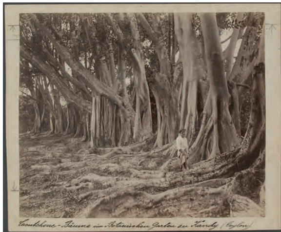
Assam-Gummibäume in den Königlichen Botanischen Gärten von Peradeniya (Distrikt Kandy, Sri Lanka) Fotosammlung VF 73156

Wäldern Nordamerikas viele Millionen von Schwarz-Eschen und bedroht damit ernsthaft die Korbflechtkultur lokaler IndianerInnen.