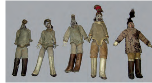
„Insassen“ eines Bootsmodells

Sammlung grönländischer Ethnographica darstellt. Obgleich die Sammlung (die unter anderem Kleidung, Wirtschaftsgeräte zur Jagd und Fischerei und Haushaltsgeräten beinhaltet) schon allein aus diesem Grunde von besonderer Bedeutung ist, wurden bis dato lediglich wenige Einzelstücke publiziert. Neben den Objekten selbst (gesammelt in den Jahren 1806-1813) soll hierbei auch auf die Person des Tänzers/Schauspielers/ Autors/ Mineralogen Giesecke eingegangen werden, auf den Verlauf seiner Reise und auf die Bedingungen, die Giesecke in seinem aufgrund der napoleonischen Kriege unfreiwillig auf sieben Jahre verlängerten Aufenthalt in Westgrönland vorfand.