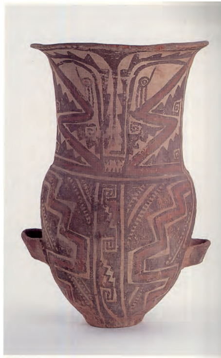
Anthropomorphe Urne aus der Sammlung Schreiber

Calchaquí's symbolism is one of the most elaborated iconological systems of representations from the Andean world. It was developed between IX and XVII centuries after Christ in the arid valleys from the Northwest of Argentina, in Catamarca, Tucumán and Salta provinces. Among its materi-