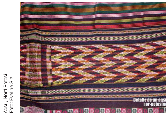
Aqsu, Nord-Potosi

Das textile Kunstschaffen Südamerikas zählt zweifellos zu den bedeutendsten kulturellen Leistungen weltweit. Nirgendwo sonst ist eine ungebrochene, Jahrtausende alte Tradition bis zum heutigen Tage so lebendig. Ausgehend von einer kurzen historischen Verortung der Textilien aus